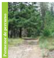
Pormenor de percurso

Importa referir que a Rota da Azinha permite interacção com a Rota de Vale de Amoreira , Rota do Corredor de Mouros e Rota de Sameiro .