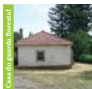
Casa do guarda florestal