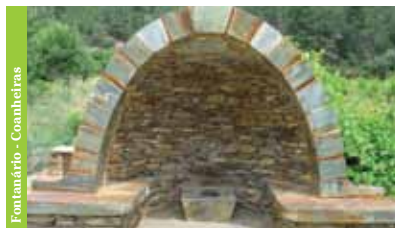
Fontanário - Coanheiras